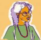
Emilia Larrondo México - EH