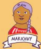
Una mujer protagonista