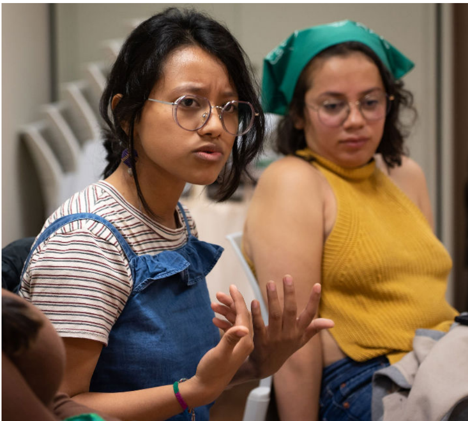
Defendatzaileen eta Azpeitiko mugimendu feministaren arteko topaketa, 2022ko urria

Topaketa feministaren baitan migrazio-prozesu emozionalei eta prozesu politiko-sozialei buruz ere hausnartu zen, baita xenofobia, arrazakeria, klasismoa eta migratzeko unean pertsona askok jasotzen duten tratua bezalako problematikak nola aurki daitezkeen ere. Horrekin batera, migratzea pertsona orok izan behar duen eskubidea dela onartzearen eta ikusaraztearen garrantzia aldarrikatu zen.