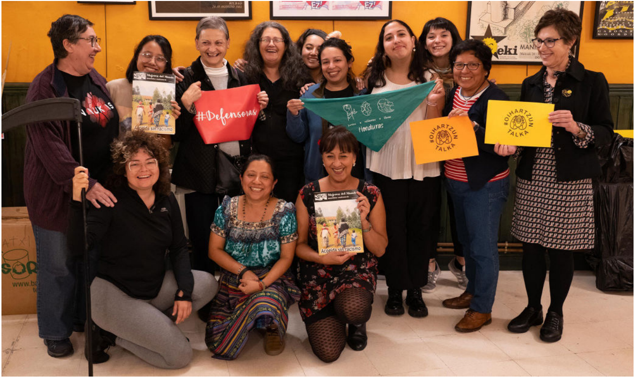
Mujeres del Mundo eta Defendatzaileen arteko topaketa Bilbon, 2022ko urria