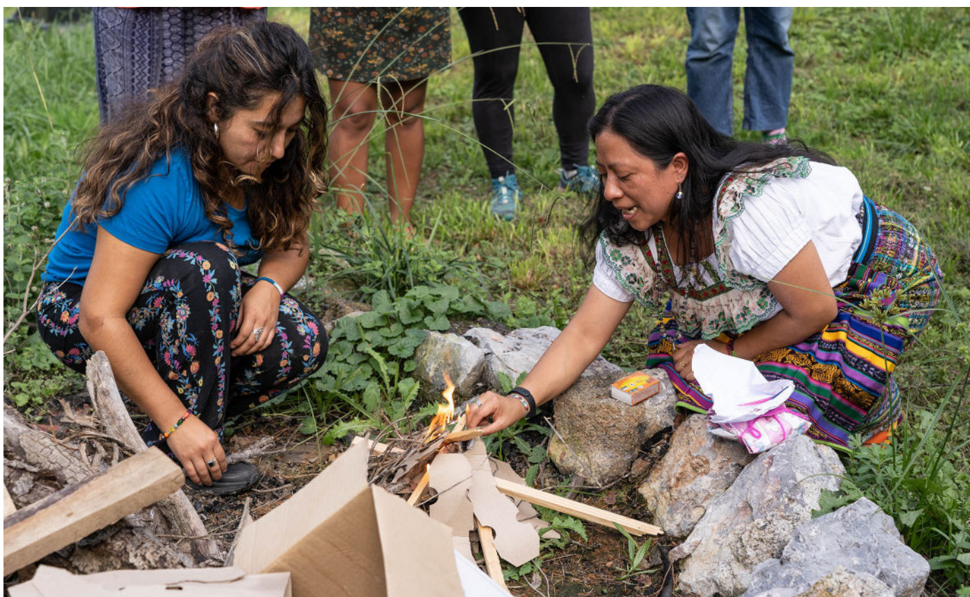
Retiro Feminista en Basoa, octubre de 2022

Sendatze-prozesuak nire begirada argitzea suposatu zuen, bihotza zabaltzea barnean nuen guztia goitik behera aldatu ahal izateko, gerrak, arrazakeriak edo genozidioek erakarrirako guzti hori alegia. Eta arbasoen jakituriaren sustraiak berreskuratu ahal izatea, arbasoen espiritualtasuna, arbasoen kosmobisioek zeukaten naturarekiko konexioa, zuk zure egunerokoan erabiltzen ez duzun hura, erabat ezabatuta zenuelako. Espiritualtasunak aukera eskaintzen dizu berriro ere osotasunaren existentziarekin konektatzeko. Antzinako kosmobisioek guztiari eman diogu nortasuna beti: aireari, urari, pertsoneri. Sendaketak aukera ematen dizu zapaltzen eta kontrolatzen zaituen guzti hori baztertzeke, eta emantzipazio prozesu bati ekiteko zuk eutsi nahi duzunarekin, zuk eutsi nahi diozun bizi paradigmarekin alegia. Eta horrek elikatzen eta osotzen zaitu.