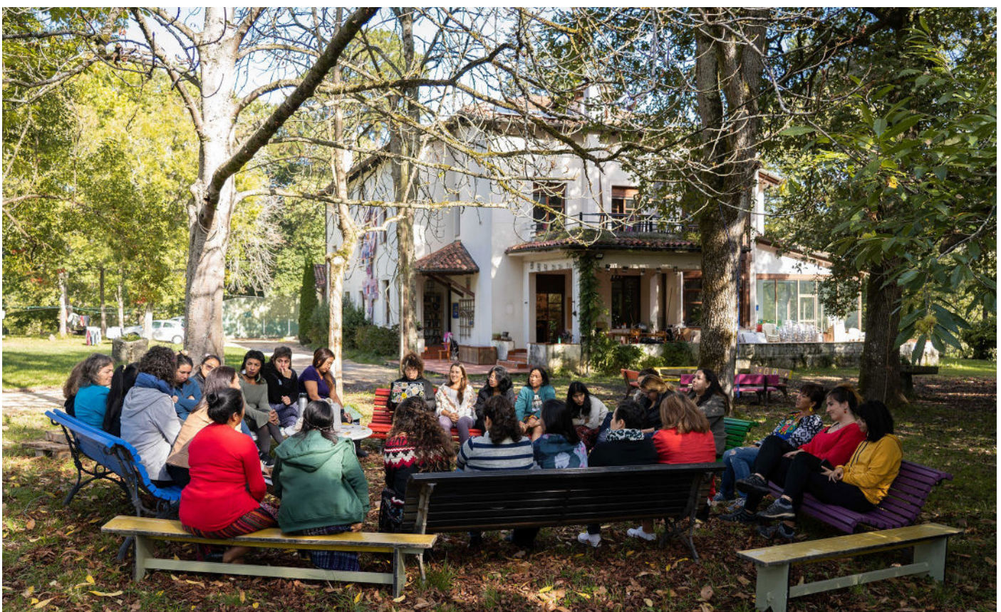
Retiro Feminista en Basoa, octubre de 2022

El poder hacer estos intercambios de información, estos intercambios culturales son muy valiosos no sólo para crecer a nivel individual o como movimiento, sino también para darte cuenta de que esto no es algo que se limita a tu territorio. Es algo regional, es algo mundial y es algo que nos une.